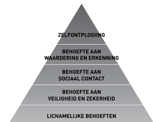
De piramide van Maslow